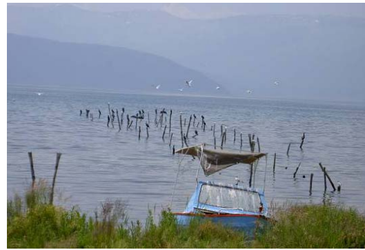
Liqeni i Prespës është i njohur si vend i rëndësishëm për shpendët, me 260 lloje të ndryshme.