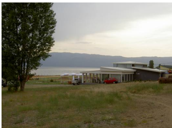
Restorante dhe hotele të reja janë duke u ndertuar në brigjet e Liqenit të Prespës (Pretor May 2008)

bashkëpunimin në vend midis strukturave në nivele të ndryshme.