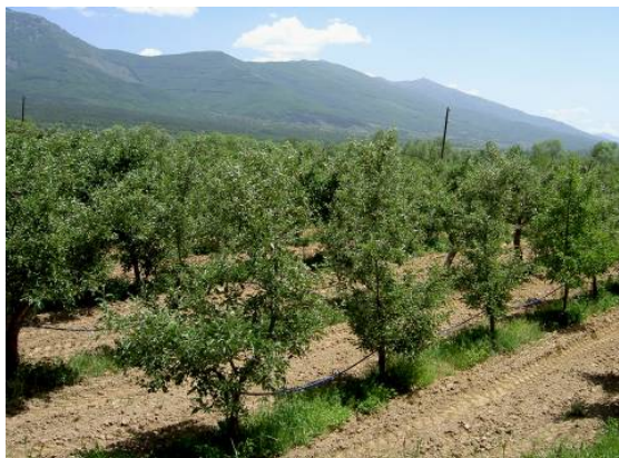
Kultura e mollës ze pjesën kryesore të prodhimit bujqësor në anën Maqedonase të Liqenit

Edhe pse nuk ishin të pranishëm të gjithë palët në rajon, këtu u krijua një pamje e drejtë për sfidat dhe gjendjen aktuale të menaxhimit në pjesën Shqiptare dhe Maqedonase të Liqenit. Sidoqoftë, u ra dakort që, që të rriten përpjekjet e përfshirjes në takimet e ardhshme edhe të palës Greke.