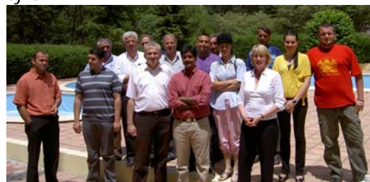
DRIMON, Eorkshopi 2008 Pjesëmarrësit

Menaxhimi i qëndrueshëm i liqenit është mjaft i rëndësishëm për një seri përdoruesish që e kanë mbështetur këtu dhe egzistencën e tyre.