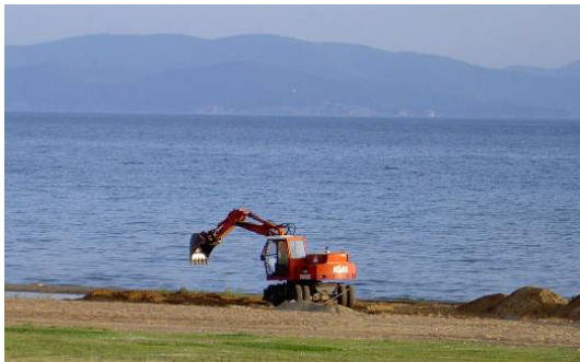
Zhvillimi i turizmit mund të sjellë çënime të habitateve (Liqeni i Prespës, Pretor Maj 2008)