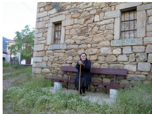
Forma e turizmit rural është duke u planifikuar

Me qëllim që të sigurohet bashkëpunimi ndërkufitar duhet të arrihen marëveshje për disa probleme. Direktiva Kuadër për Ujin e BEsë është e dobishme në këtë kontekst, dhe Prespa mund të jetë si basen pilot për zbatimin e direktivës në të tre vendet - kjo gjë konsiderohet edhe nga ana e DRIMONit.